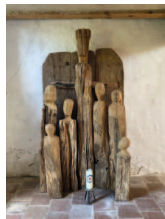
St. Johannes

18:00 Heilig Kreuz , Gottesdienst am Gedenktag der Confessio Augustana