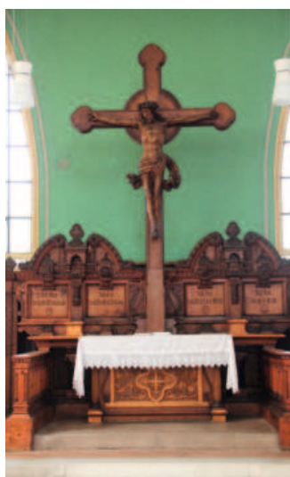
Evangelische Trinitatiskirche in Arco