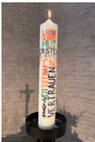
Zu den Barfüßern | Foto: Lackner-Becker

18:00 Protestantischer Friedhof, Abendandacht (Hueck) 19:00 St. Jakob, Himmelsleiter-Gottesdienst (Team)